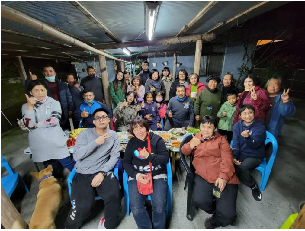
舉辦聚餐活動，活絡組織間氣氛