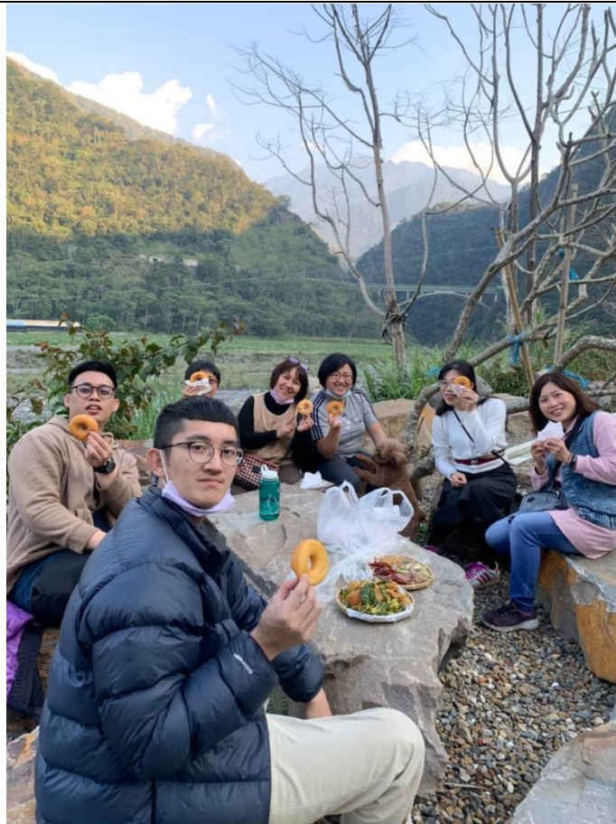
辦理師康活動，強化組織同仁間的默契