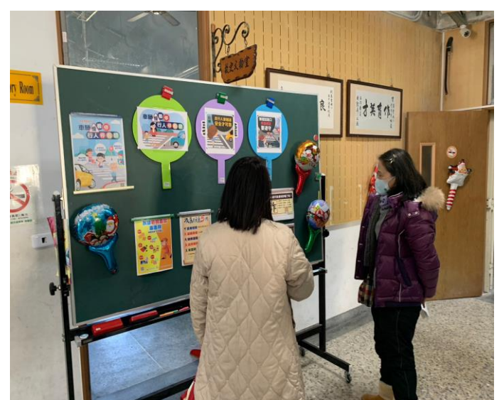
職講座向家長宣導遵守交通規則之重要性。