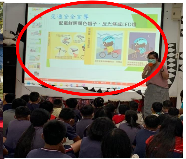
學生集合時宣導校外、部落常見交通違規事件。