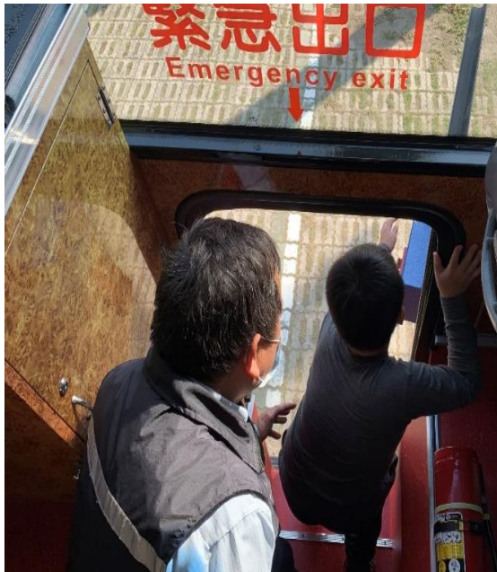
出發前車輛安全審核，滅火器裝置。