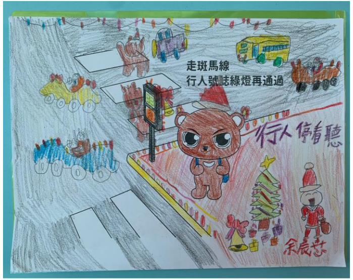
交通安全入口網-交通安全學習單