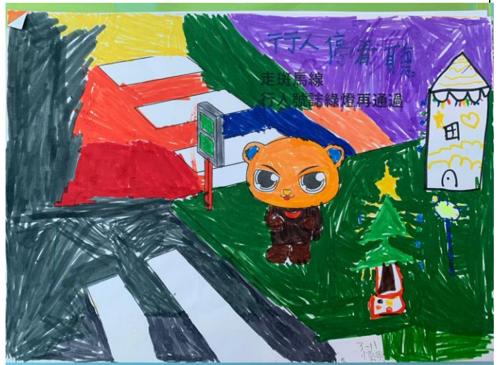
交通安全入口網-交通安全學習單