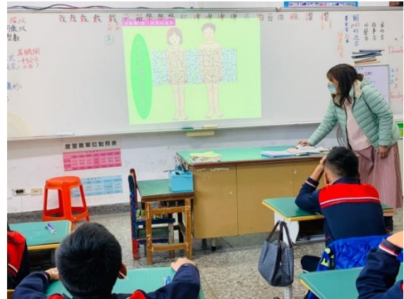
教師講解身體重要部位