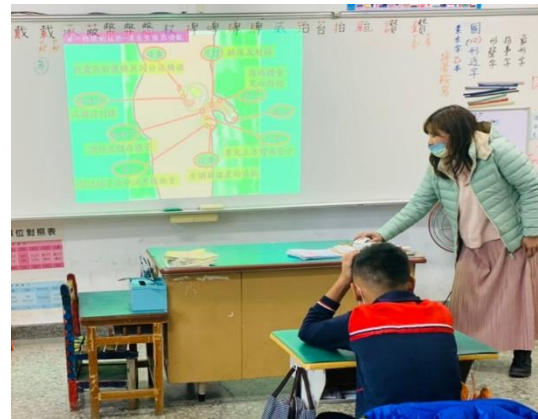
講解男性外生殖構造