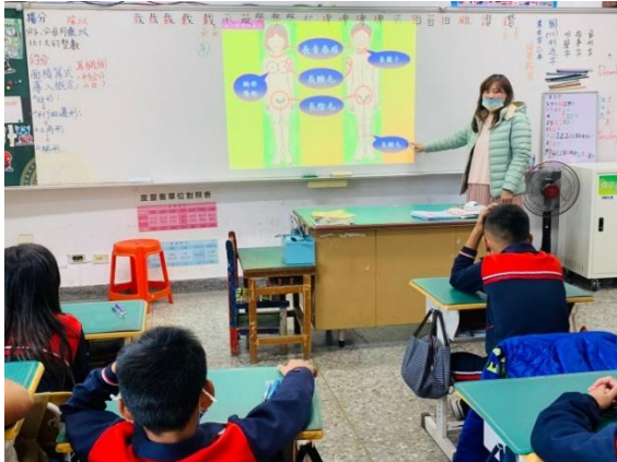
教師講解男女生理構造