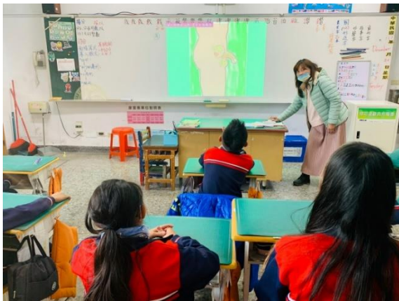
講解男性外生殖構造