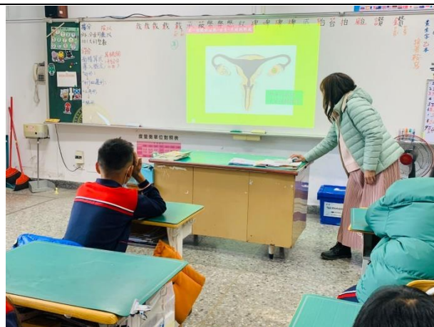
講解女性生殖內構造