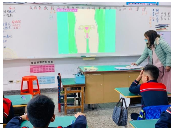
講解女性生殖內構造