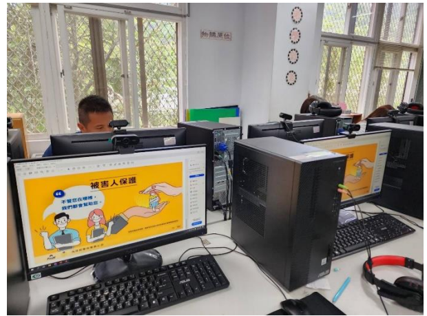
跟騷法立法以後，讓許多人生命自由等安全都受到保障