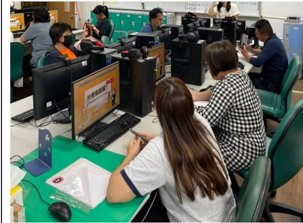
112年5月10日進行跟騷法的相關研習