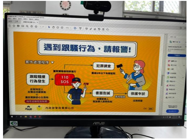
遇到跟騷行為時的解決策略