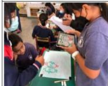
教學觀察-學生學習