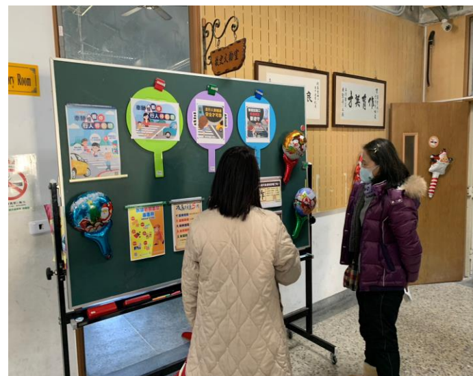
職講座向家長宣導遵守交通規則之重要性。