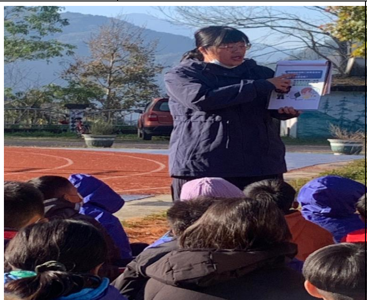
學生集合時宣導校外、部落常見交通違規事件。