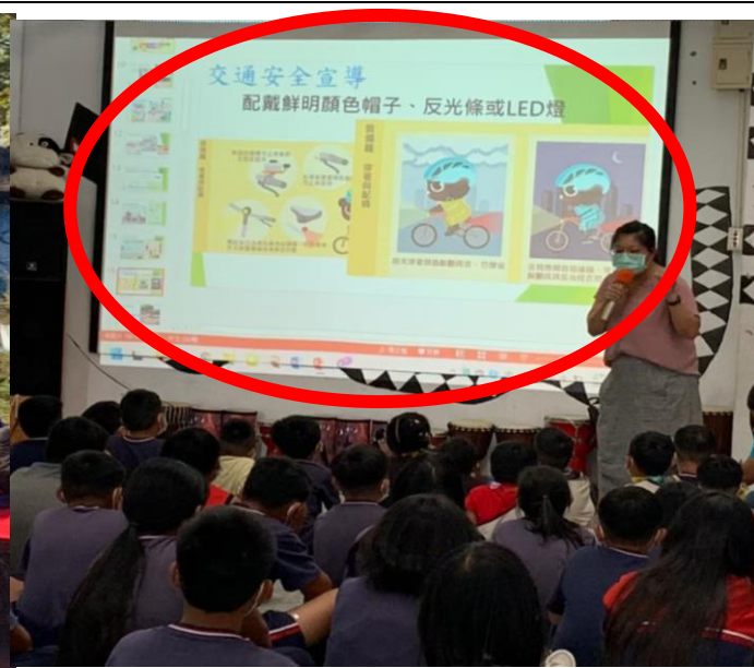
學生集合時全校：宣導騎乘自行車放慢車速且依規定戴安全帽。