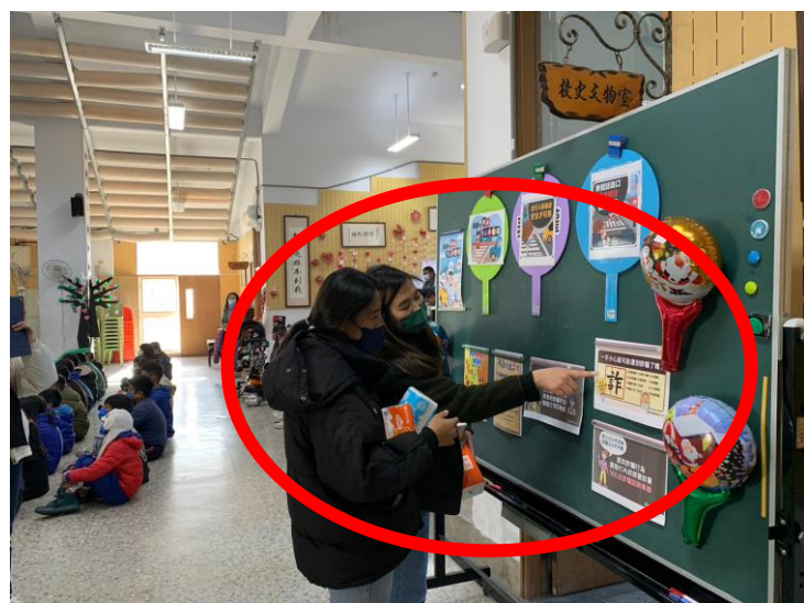
職講座向家長宣導遵守交通規則之重要性。